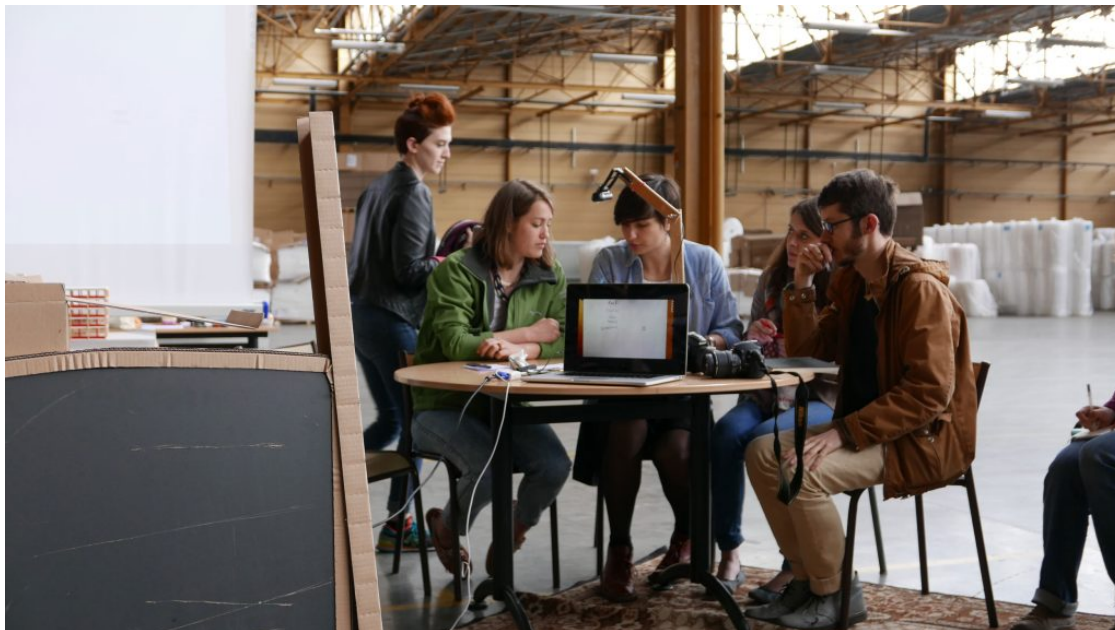
Préfigurations sur site à la permanence de l'Université Foraine à Bataville, 2015