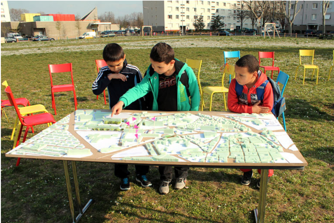
Maquette du quartier de La Gauthière, permanence de l'Université Foraine Clermont-Ferrand, 2015

La permanence a pour but de faire advenir le projet avant le projet. En fédérant et en construisant de manière collective, elle participe à faire émerger la capacité des acteurs à s'investir dès le départ dans le projet, de manière itérative, en occupant l'espace. Ainsi elle participe à l'activation de la démocratie locale. Le processus de fabrication devient plus important que la finalité même de l'objet du projet. Pour cela, elle peut par exemple (liste non exhaustive) : accueillir les acteurs désireux de tenir une activité concrète ou de recherche-action sur le site même du projet ; lancer des chantiers démonstrateurs annonciateurs de la manière dont le projet va se construire ; préfigurer des usages ou des modes de fabrications et de construction, d'aménagement de l'espace par le biais de workshops ou de constructions de maquettes à l'échelle 1.