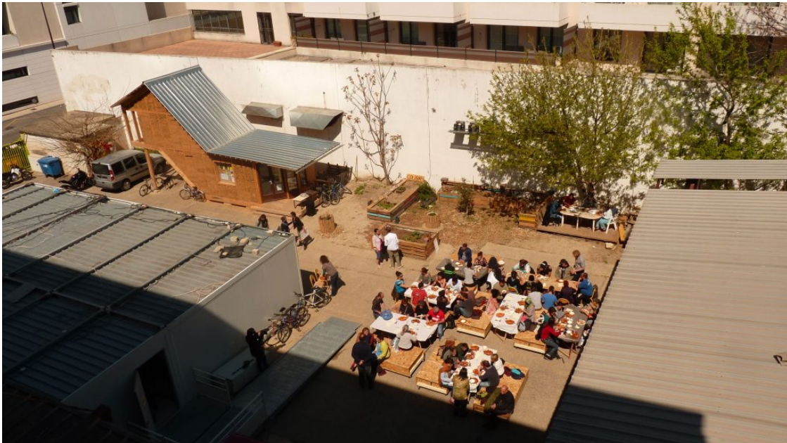
Déjeuner partagé au Tri Postal, permanence de l'Université Foraine Avignon, 2014

Par exemple, il pourra s'agir de prévoir dès les premières phases d'études un budget destiné à la réalisation de premiers aménagements ou de micro-chantiers démonstrateurs. Ou encore, de penser les conditions d'un véritable lieu de vie et d'accueil pour la permanence, en évitant l'effet Algéco, avec une cuisine ouverte, un lieu de réception du public mais aussi des réunions techniques et de pilotage, un lieu d'enseignement et de formation. Si l'opérateur intègre cette méthode, il faudra monter une équipe plurielle dès le départ et tout au long des phases : depuis les études de programmation, en passant à l'écriture et au lancement de l'appel d'offre aux maîtrise d'œuvre, jusqu'aux phases d'accompagnement à la conception, à la réalisation et à la réception (c'est cas de l'Hôtel Pasteur avec Territoires Publics, de la Caserne Beaumont – Chauveau à Tours avec la SET, et de la Halle des Grésillons à Gennevilliers avec la SPLA Paris Sud Aménagement).