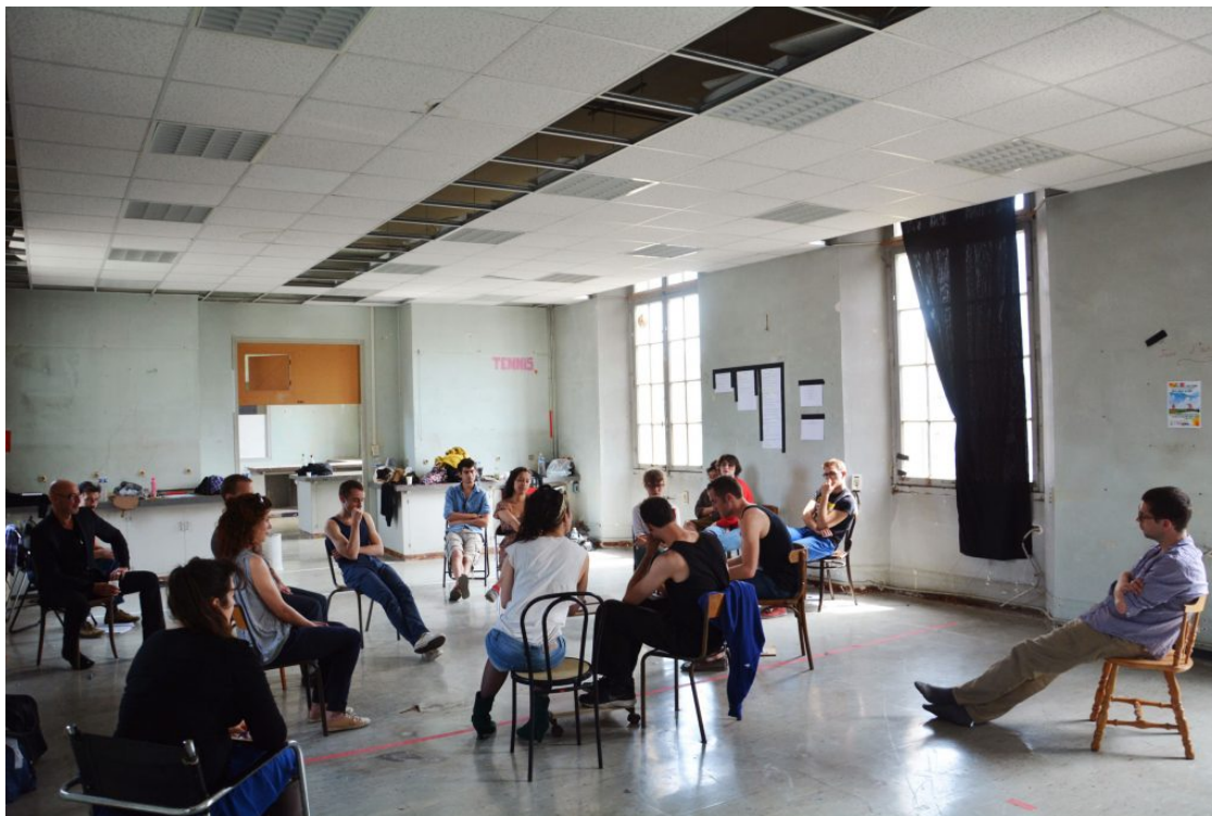
Échanges à Pasteur, permanence de l'Université Foraine Rennes, 2013

commençant à fédérer les parties prenantes du projet sur son site même.