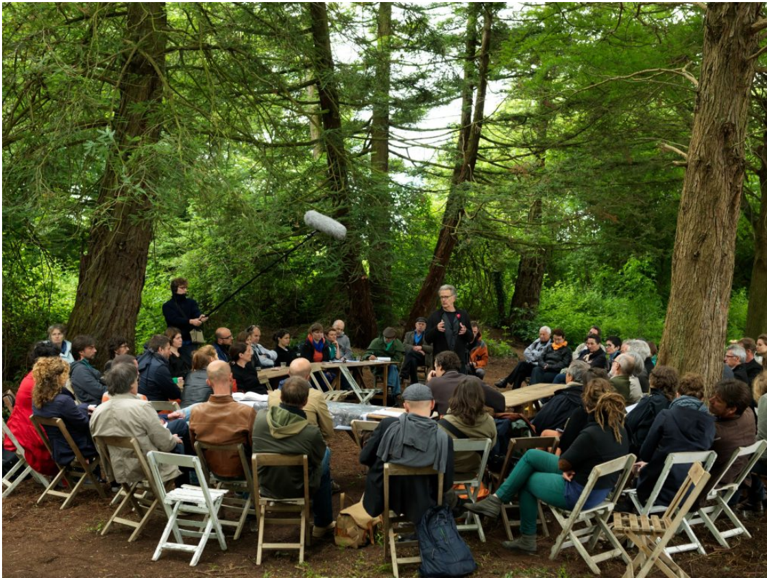
L'université foraine près des étangs d'Apigné, 2013