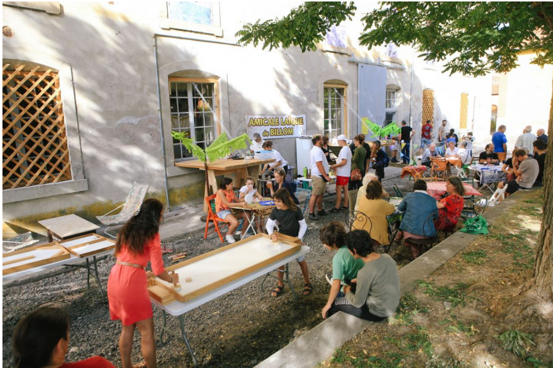
Journée d'action à la Perm, permanence de Rural Combo dans l'ancien collège de Billom, 2019

La permanence s'incarne dans un lieu, un temps, et dans une ou plusieurs personnes, qui portent et investissent ces missions. La permanence agit comme une rotule entre l'élu-e et les citoyens, les institutions et la société civile, les techniciens et les artisans, la demande et les usages, les désirs et les possibles. Elle a pour fonction de dévoiler et d'activer, sur le terrain même où un problème sociétal se pose, dans le cadre d'un projet architectural ou urbain, les « possibles ignorés » 5 . En mettant à l'épreuve un terrain d'action, elle propose alors de faire une « programmation ouverte ». En évitant de programmer à l'avance la chose à rénover ou à bâtir, elle permet d'ouvrir le champ des impensés en permettant à d'autres acteurs d'occuper un espace, afin qu'ils se l'approprient et lui redonnent ainsi une nouvelle valeur d'usage. C'est en ce sens qu'elle peut, à son échelle, être un levier d'activation de démocratie locale dans la fabrique de la ville.