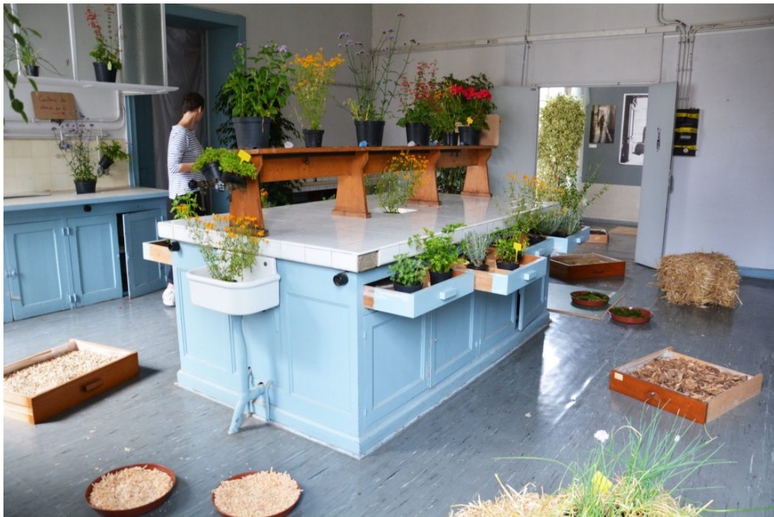
Accueillir des usages impensés à Pasteur, permanence de l'Université Foraine Rennes, 2013

Pratiquée depuis plusieurs années maintenant sur différents territoires 3 , la permanence architecturale implique d'habiter un territoire sur un temps long, pour contribuer à sa transformation et agir en amont de tous dessins souvent fabriqués ex-nihilo. Elle part du principe qu'habiter est l'acte déterminant pour appréhender un contexte, comprendre et vivre ses enjeux, et ainsi pouvoir partager des perspectives d'améliorations. En ce sens la permanence implique un changement de posture profond, tant intellectuel que pratique et technique, dans les métiers de la fabrique des territoires, la maîtrise d'ouvrage et la maîtrise d'œuvre. Pour servir l'intérêt général et l'amélioration réelle de nos conditions de vie en commun, l'architecte ne peut plus rester le dernier maillon de la chaîne de production de la commande publique dans l'acte de construire. La permanence architecturale devient alors le levier pour accompagner en amont le politique et le technicien à l'écriture de celle-ci, et ainsi relier les phases et les acteurs de la commande et de sa réalisation, souvent distendus et dissociés.