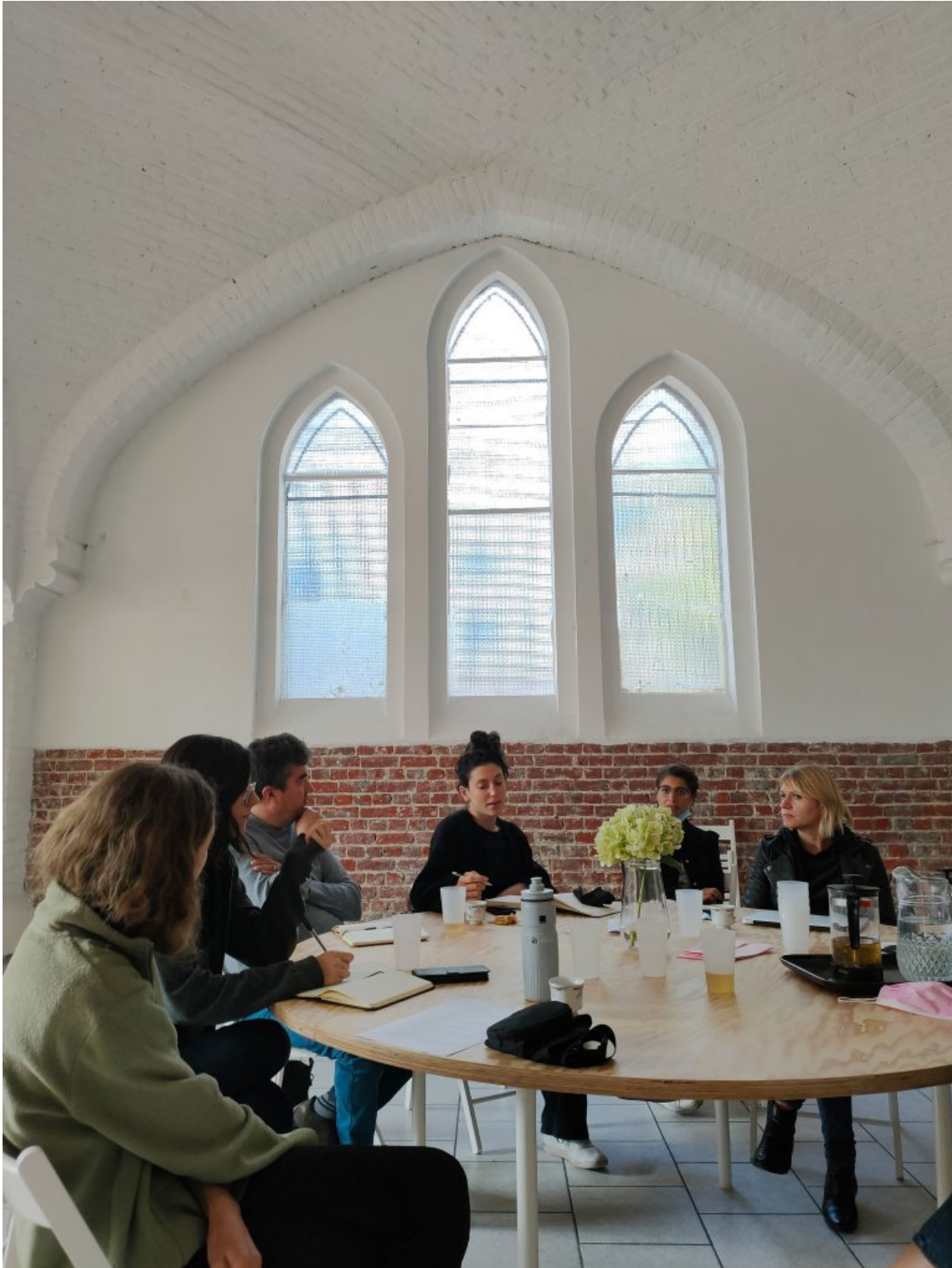
Conseil de vie avec les occupantEs du couvent des Clarisses, Saisons Zéro

La méthode de la permanence peut aussi être directement portée au sein des organismes de maîtrise d'ouvrage comme les services d'aménagement de la commune, les opérateurs comme les Sociétés Publiques Locales d'Aménagement (SPLA) et les Offices Publics d'Habitations à Loyer Modéré (OPHLM), les foncières et autres petites associations ou coopératives de maîtrise d'ouvrage. Cela implique pour l'opérateur ou les services de travailler au plus proche du terrain, en prise avec un quotidien autre que celui du travail en bureau.