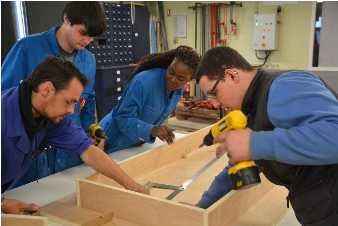
Le lieu ne perdra jamais sa destination principale, celle de l'accompagnement et de la formation hors des cadres, 2017 © Hôtel Pasteur

Au-delà d'une stricte et standard « Maison du projet » qui est destinée en premier lieu au travail autour du projet, le lieu de la permanence est un espace ouvert sur le quartier, public, et identifié comme le lieu de rassemblement mais aussi comme un lieu de vie capable de répondre aux besoins concrets de la population. On peut l'imaginer comme un « tiers-lieu » ressource pour les habitants, mais aussi un lieu d'apprentissage, de brassage des cultures et de formation collective autour et à partir du projet. Il peut en ce sens préfigurer l'arrivée d'une future cité de chantier.