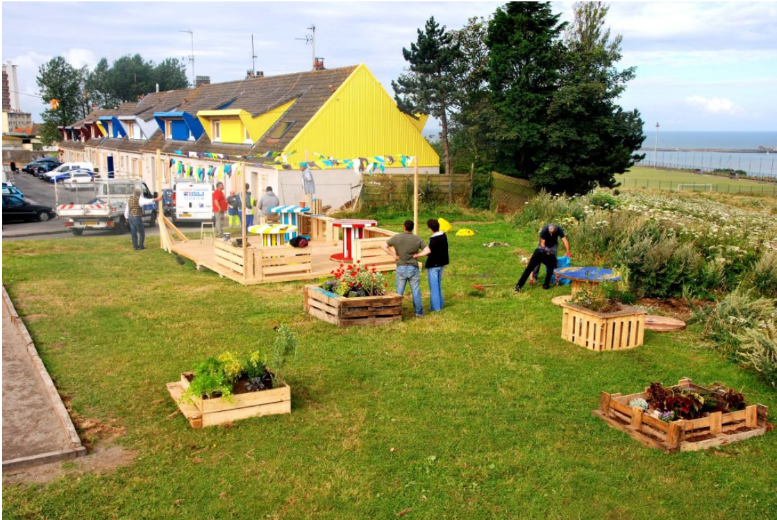
En 2010, Sophie Ricard s'installe dans l'une des maisons vacantes des rues Delacroix et Molinet à Boulogne-sur-mer pour y mener une permanence architecturale et travailler sur l'appropriation du logement social en habitant le quotidien d'une rue et de ses habitants.

programmation à construire) en en faisant soi-même l'expérience. Cela nécessite un accord préalable avec l'opérateur, qui peut prendre la forme d'une mise à disposition gratuite par un prêt à usage ou une convention d'occupation précaire d'un local sur site, d'un appartement, ou à l'intérieur même du patrimoine/bâtiment à requestionner. La permanence peut aussi s'inscrire dans le cadre d'une mutualisation de locaux en vue d'occuper différemment un espace, avec d'autres parties prenantes qui peuvent être associées à l'opération.