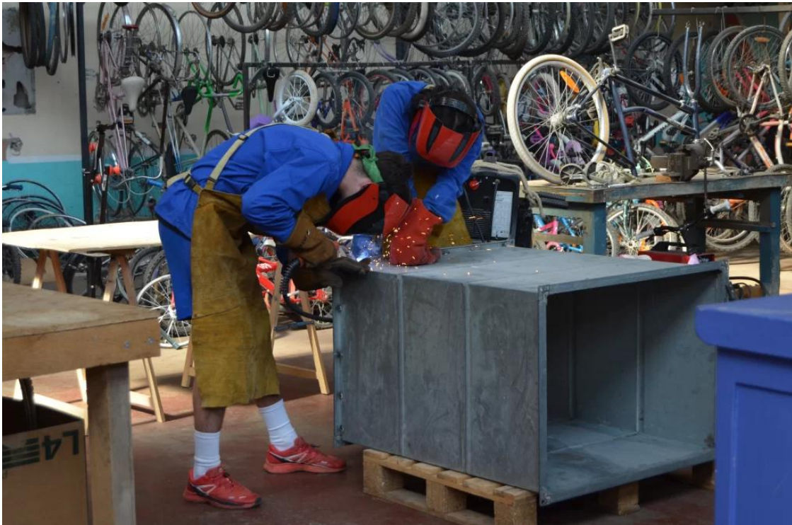
Activités pédagogiques