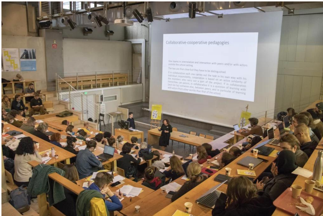
Colloque « In situ, avec et par l'expérience. Pédagogies « hors les murs » dans les écoles d'architecture, d'urbanisme, de paysage » © ASOC – CRESSON-AAU