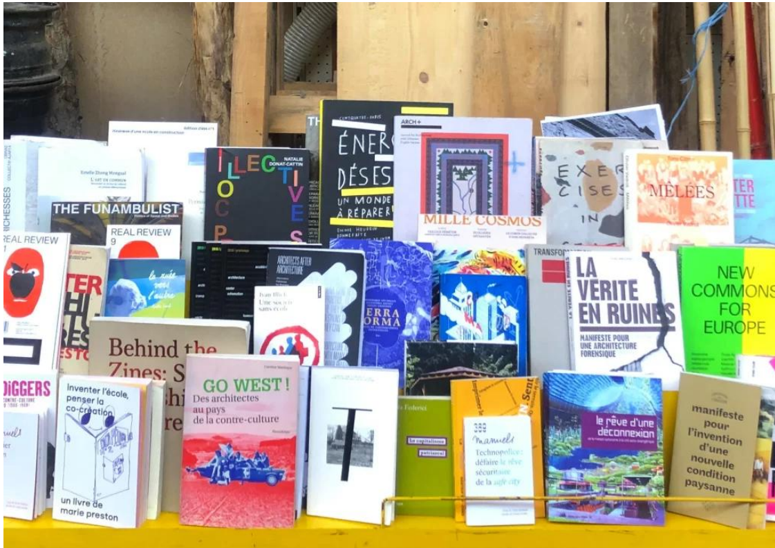
Bibliothèque mobile