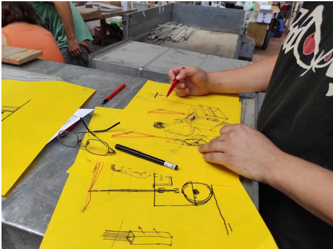
Activités pédagogiques

d'activation intéressantes et fédératrices suivent les workshops à la Place des Possibles, mais l'expérience n'est pas valorisée localement et les productions ne sont pas utilisées pour déclencher des dynamiques ultérieures.