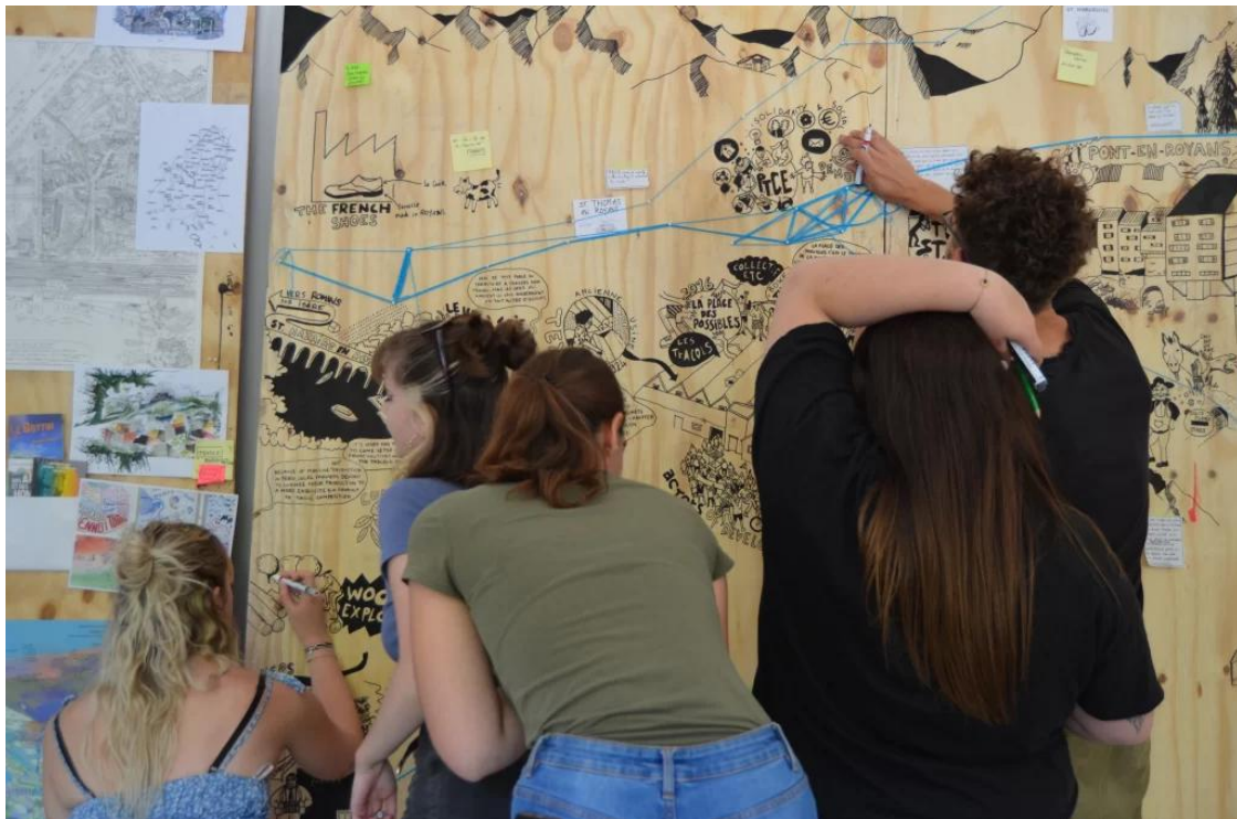
Activités pédagogiques

Les workshops et summer school réalisés jusqu'ici, et notamment ceux en France, ont plongé les participant-es dans une réalité locale et ont donné un aperçu de ses problématiques, acteurs, dynamiques sociales, économiques et politiques. Les activités pédagogiques ont permis l'arpentage du territoire proche, la rencontre avec les habitant-es et acteurs-ices locaux-les, l'expérimentation d'outils et techniques de construction (bois, pierre, métal), d'impression (sérigraphie) et de montage vidéo et son. Les productions ont été variées (installations, mobilier, affiches, cartes sensibles, fanzines, podcasts...), et ont été réalisées pour "activer" les lieux (tant en termes architecturaux que événementiels), restituer des dynamiques locales, questionner les locaux.