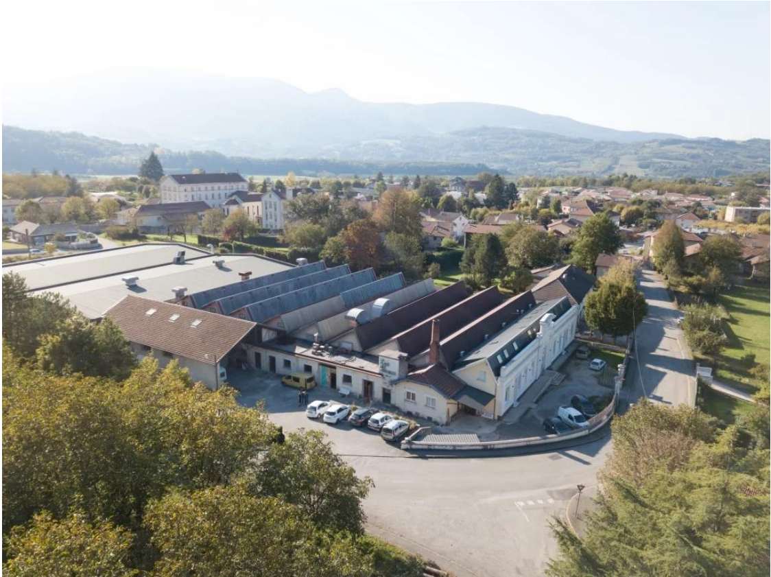
L'un des trois sites du projet ASOC : La Place des Possibles