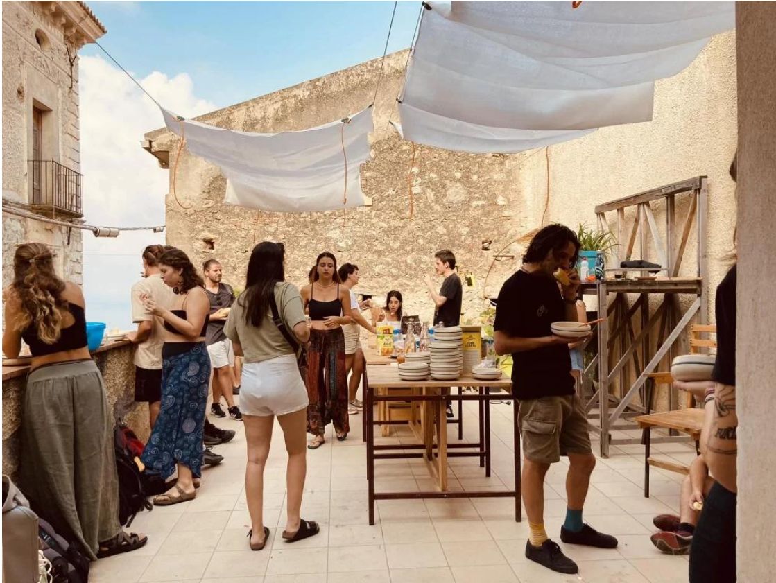
Un moment d'une pédagogie "hors les murs"

Ce récit fictif n'est pas très éloigné de la réalité de ce que nous dénommons les « pédagogies hors les murs », mises en place en école d'architecture, d'urbanisme, de paysage, afin d'accompagner les apprentissages d'étudiant-es au contact (d'une partie) des réalités spatiales, opérationnelles, professionnelles actuelles. En effet, face à de multiples défis de nature politique, économique et écologique, les mondes professionnels de la fabrique des territoires habités évoluent rapidement et en profondeur 1 , des nouveaux modes d'aménagement du territoire émergent, témoignant tant de l'ouverture des pratiques de projet 2 que de l'évolution des formations en école d'architecture, d'urbanisme et de paysage. Ces expériences pédagogiques « hors les murs », bien que pas nouvelles mais multipliées ces dernières années, en sont la preuve. Elles amènent les étudiant-es et les enseignant-es en immersion dans un territoire, à la rencontre de ce dernier et de ses acteurs ; elles font « entrer du réel en formation » 3 et permettent d'éprouver « l'expérience d'une réalité, par l'engagement du corps, afin d'en tirer des apprentissages » 4 .