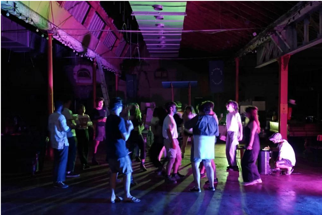
Le « off » du « hors les murs »

Une question centrale concerne les traces/les effets que les pédagogies « hors les murs » laissent (ou pas) sur les territoires qu'elles investissent une fois que les acteur-trices protagonistes de ces pédagogies ne sont plus présent-es. Si le temps d'une semaine ou d'un semestre les étudiant-es et enseignant-es ont pu apporter de l'énergie, de l'attention et du soin à un territoire, est-ce que cela répond suffisamment et justement aux besoins locaux ? Les pédagogies en question ne remplacent pas (ou ne devraient pas remplacer) les apports des professionnels pour répondre aux problématiques des territoires mais, comme vu précédemment, elles peuvent, dans certains cas, décentrer les acteurs du territoire avec lesquels les étudiant-es et enseignant-es sont en contact. Pourtant, les manques structurels d'accompagnement de ces territoires (souvent choisis, comme précisé plus haut, parce qu'ils manquent justement d'ingénierie territoriale) ne sont pas comblés par les expériences « hors les murs ». Que reste-t-il alors après le temps des pédagogies en question ? Le décentrement des acteurs est-il un apport suffisant pour les territoires ?