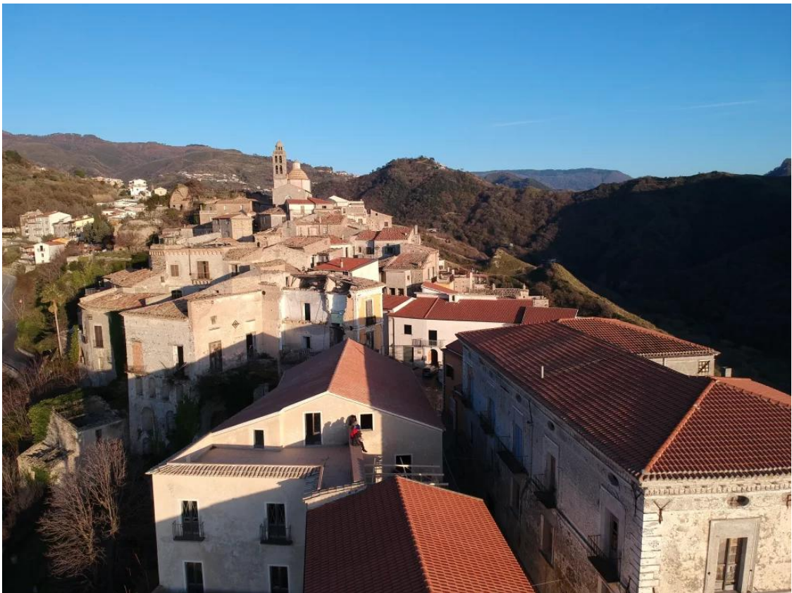
L'un des trois sites du projet ASOC : La Casa di Belmondo