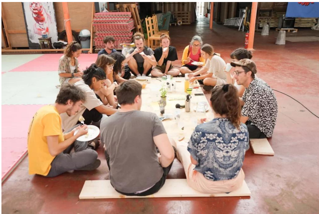
Moments d'échange et de partage

Apparues en France dans les années 1960, elles sont portées par un nombre grandissant d'enseignant-es-chercheur-es, convaincu-es de l'importance d'amener du réel dans les cursus et les exercices de projet, souvent « hors sol » (hormis le temps dédié à la visite du site d'exercice). L'engagement des encadrant-es est fort quand l'on pense à la gestion administrative et logistique nécessaire pour amener les étudiant-es hors les murs. C'est pourquoi, certains écoles, d'architecture notamment, les revendiquent comme signe distinctif d'un parcours de master ou de l'établissement : c'est le cas de l'ENSA Grenoble, qui affirme développer « une pédagogie innovante (...) par l'expérimentation dans les ateliers technico-pédagogiques permettant de conjuguer étroitement conception et réalisation ».