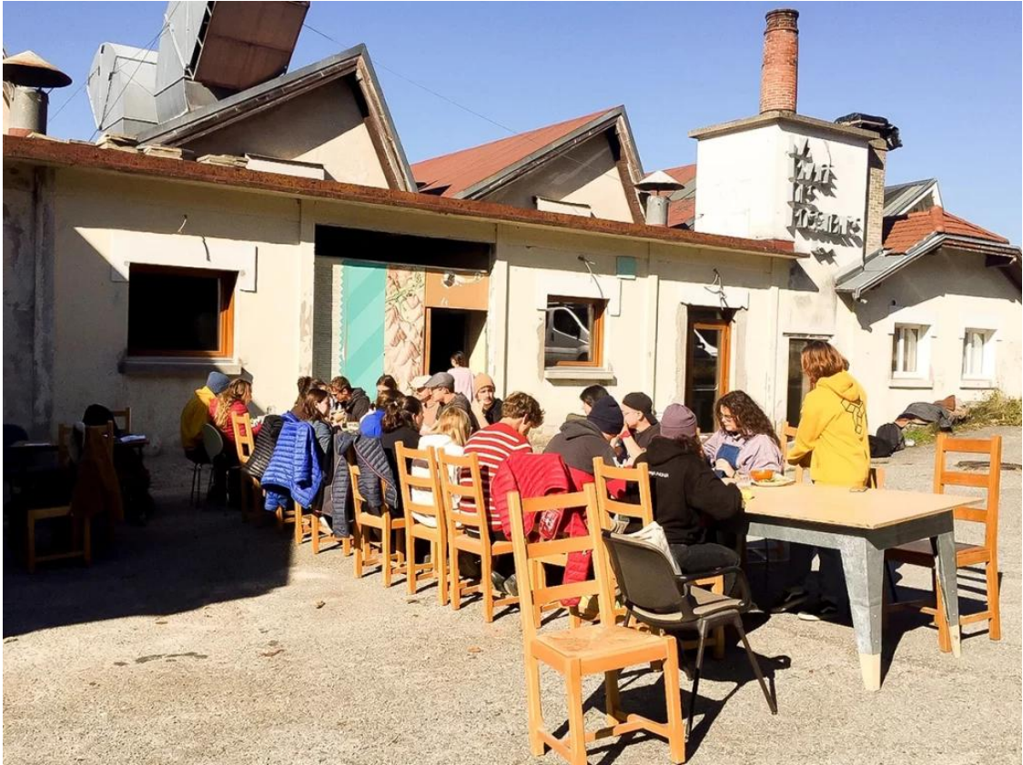
La Place des Possibles à Saint-Laurent-en-Royans

Ces pratiques professionnelles, ces sujets et ces lieux sont l'objet de fantasmes et d'envies dans les écoles d'architecture : parfois évoqués dans le cadre d'options en master, on les retrouve au sein des mémoires, on les diffuse par une communication soignée lors d'événements, de festivals, de prix... Là, il s'agissait pour nous de les intégrer très tôt dans l'enseignement (dès la licence 2), pour donner à voir la complexité de ces pratiques, les questions qu'elles posent et les difficultés auxquelles elles font face, avec un regard qui se voulait aussi critique et pas seulement idéaliste.