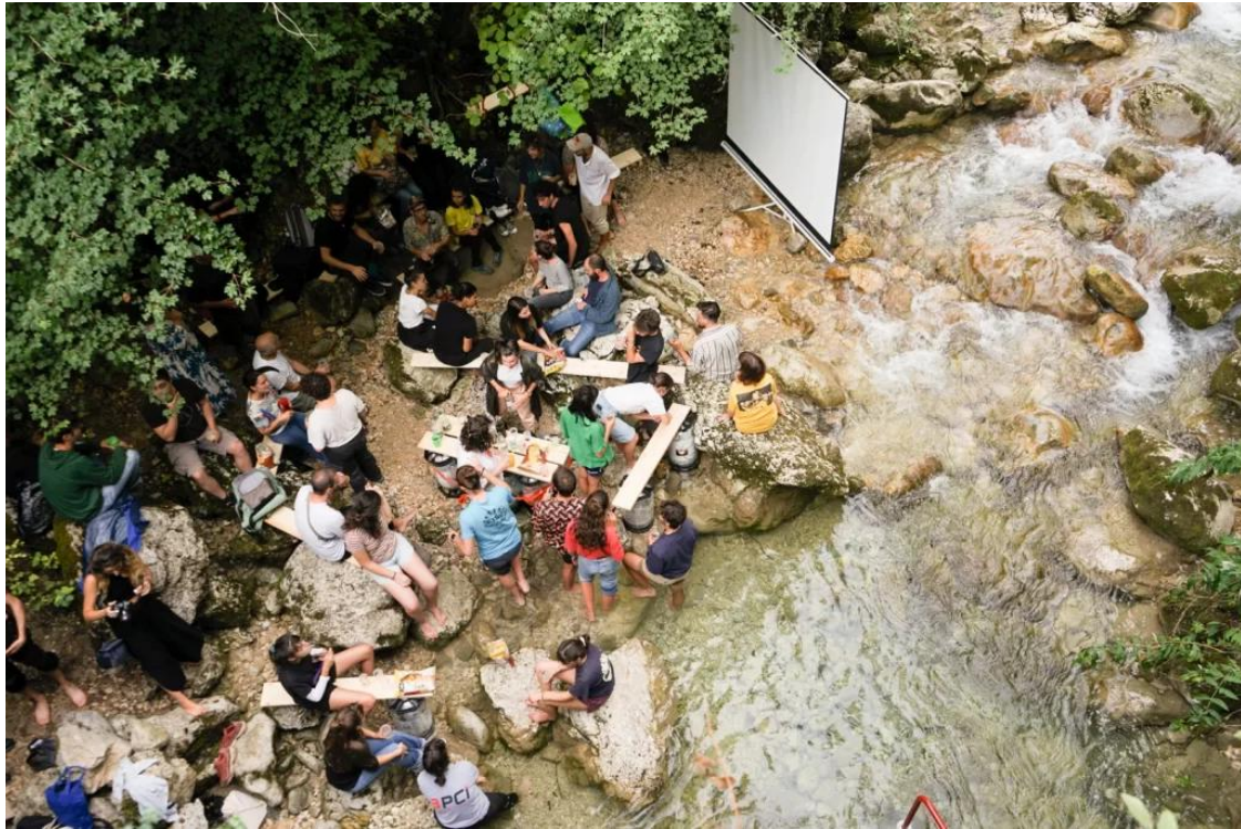
Apprendre hors les murs

– Collaborative-coopérative 13 : on apprend « en interrelation et en interaction avec les pairs. C'est lors du travail en équipe, la mise en commun de la créativité, des ressources, des compétences de chacun qu'on atteint un but commun » 14