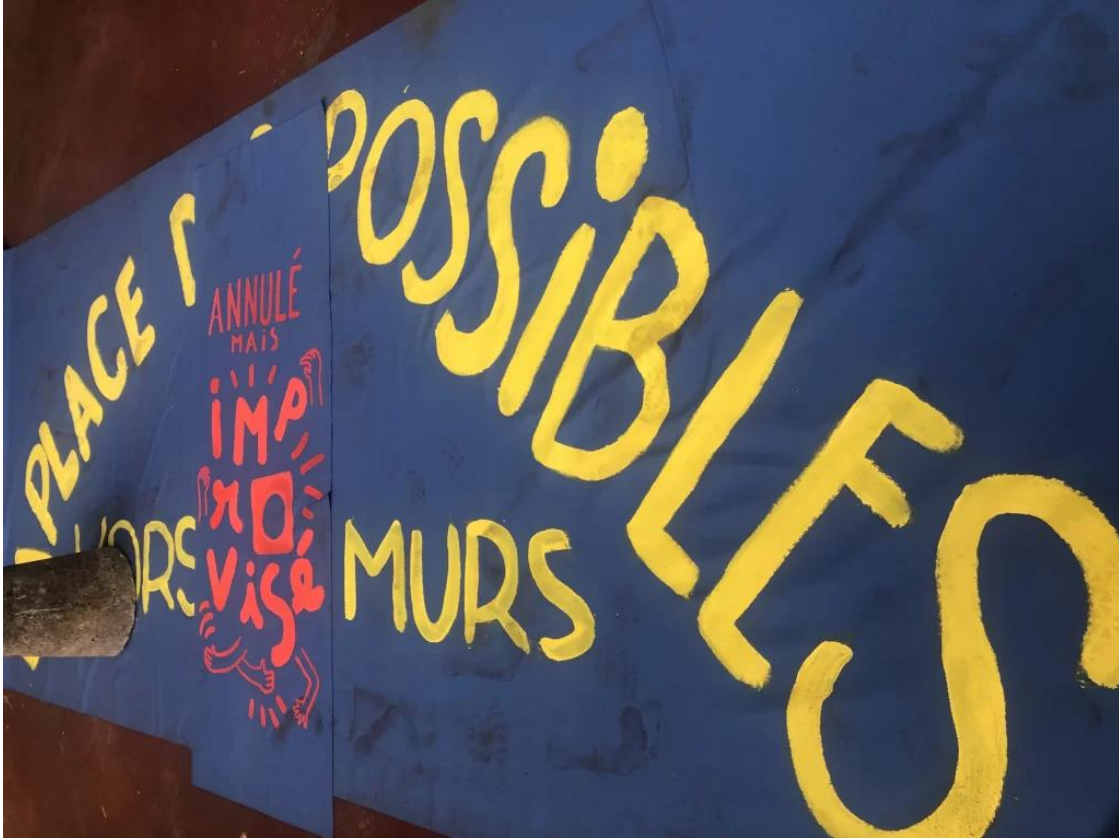
Improviser, dans le processus de projet

formation en architecture, en lien avec ce que l'on pourrait qualifier d'une éthique de projet ou d'une éthique professionnelle 55 est en cours dans nos institutions. Cet élargissement encore en définition amène aussi, dans certains cas, à d'autres débats, touchant plus directement les pratiques professionnelles, vifs ces dernières années. Bien que très différentes par nature, ces expériences nous renseignent toutes néanmoins sur la manière dont certaines pédagogies concrètes – in situ , à l'échelle 1/1, avec la participation intégrée de nombreux-ses acteur-rices - permettent d'ouvrir de nouveaux champs d'application pour les architectes, et notamment les champs de la déprise d'œuvre 56 ou de la diversification des métiers 57 .