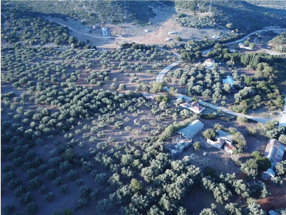
L'un des trois sites du projet ASOC : les écoles de Morfi