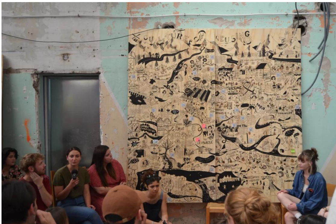
Exemple de production